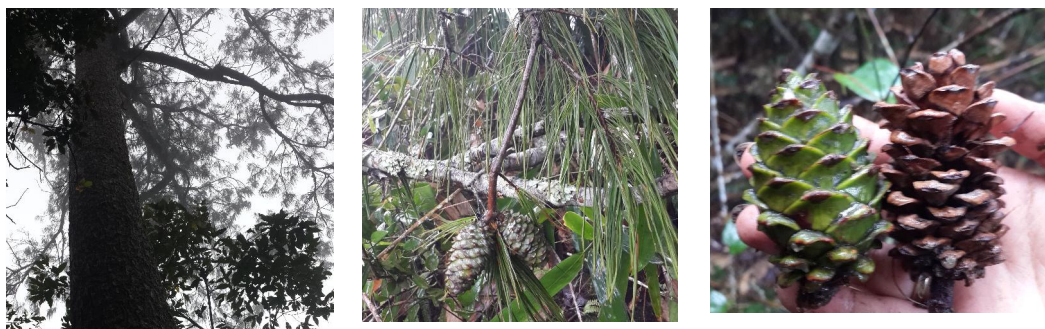
Hình 1. Thông xuân nha tại khu vực nghiên cứu

Thông xuân nha là loài cây gỗ thường xanh, cao đến 25 - 30 m với đường kính thân ngang ngực đến 0,7 - 0,9 m, có khi hơn. Vỏ thân màu nâu thẫm, dày, bong thành các mảnh hình chữ nhật dọc; lớp vỏ spong mỏng, trắng. Tán thưa, hình ô khi già. Cành mang lá ngắn. Các bó lá tập trung thành túm ở đầu cành. Mỗi bó 5 lá, 15 - 24 cm, buông rủ xuống, có mặt cắt ngang hình tam giác, mảnh, hơi vắn. Các bó lá xòe ra và rời quặp ngược lại treo thông, có răng nhỏ mịn ở mép. Bẹ gốc lá rụng sớm. Nón quả lớn, chiều dài 7 cm - 10 cm, đường kính 5 - 7 cm, trong chứa nhiều hạt lớn, có kích thước trung bình 0,5 x 1 cm. Nón hạt đơn độc, có khi mọc đôi 2, hay mọc vòng 3-4, khi chín tạo nên với cành một khoảng 90 độ, có cuống cỡ 2 x 8 cm, tự mở ngay ở trên cây để hạt rụng xuống, màu nâu thẫm, hình trứng hơi dài. Vảy hạt hình trứng ngược hoặc hình thoi. Mặt vảy hạt hình thoi hay tam giác, không có gờ lồi, chóp tù tròn, tất cả đều hơi cuộn ngược ra ngoài; rốn màu đen đen. Hạt màu xám đen, không cánh, hạt hình trứng ngược-hẹp, hơi dẹt, cỡ 12 x 6 x 4 mm, mang cánh tiêu giảm mạnh, vỏ hạt dày.